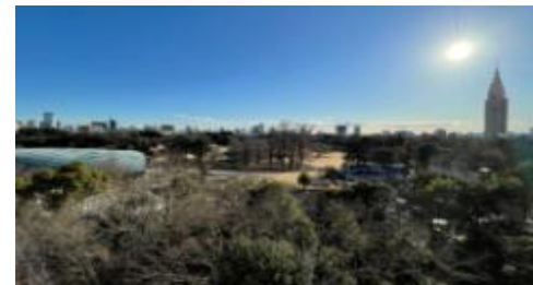
【801号室から撮影した画像です】