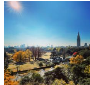
【1001号室から撮影した画像です】