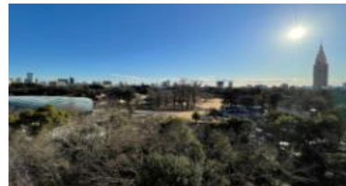
【801号室から撮影した画像です】