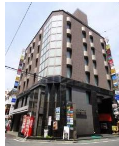
※図面と現況が異なる場合は現況を優先させていただきます。